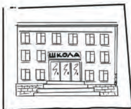
Забрать брата из школы